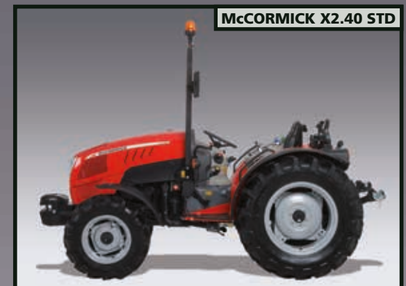
McCORMICK X2.40 STD