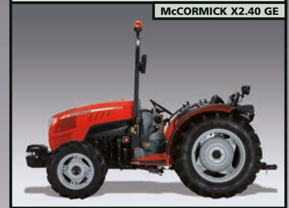
McCORMICK X2.40 GE